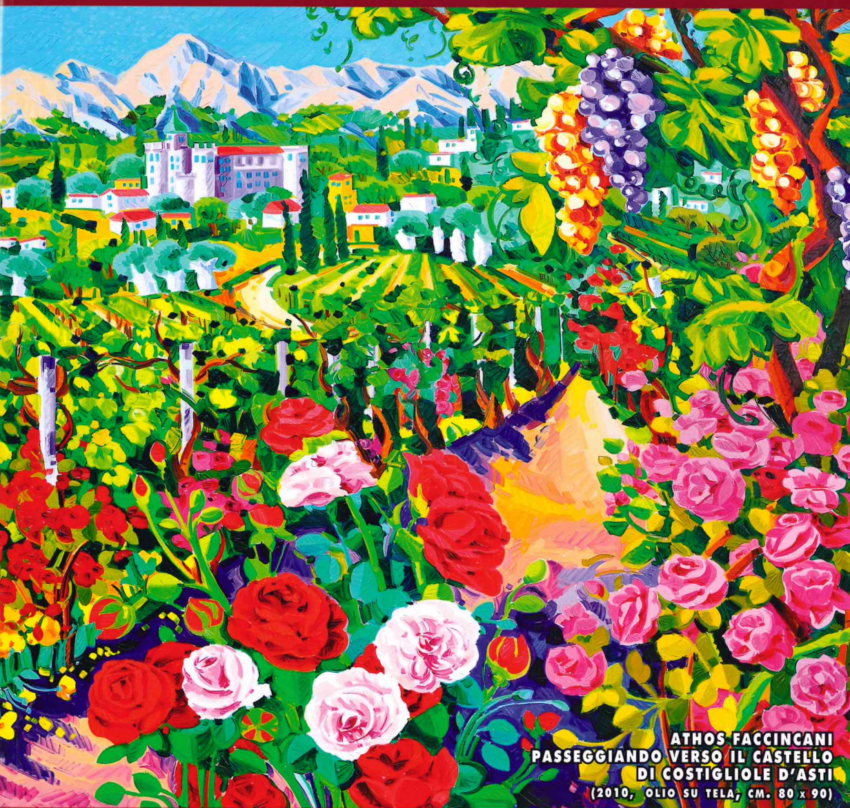
ATHOS FACCINCANI PASSEGGIANDO VERSO IL CASTELLO DI COSTIGLIOLE D'ASTI (2010, OLIO SU TELA, CM. 80 x 90)

MAGAZINE BIMESTRALE SULL'ECCELLENZA ARTISTICA, CULTURALE ED ENOGASTRONOMICA ANNO V N. 18 EURO 5 IN ITALIA - CHF 10 IN SVIZZERA - DIRETTORE: FABIO CARISIO - GOSPA EDITRICE